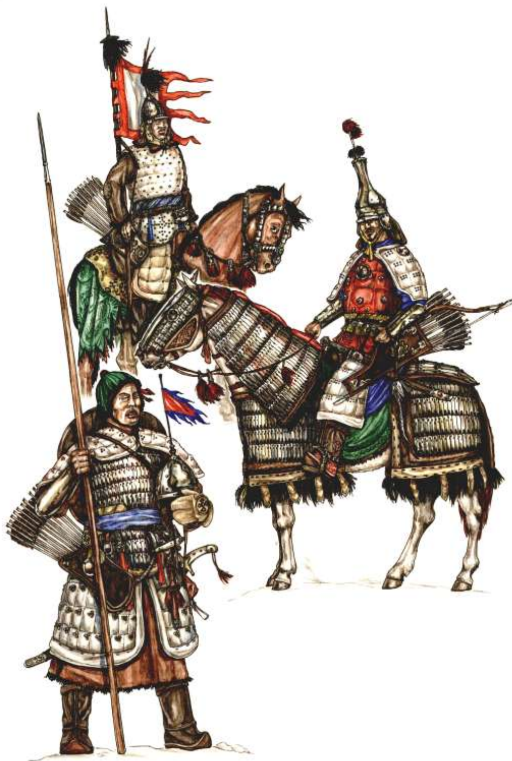
Рис. 4. Графическая реконструкция внешнего вида средневековых воинов Южной Сибири (воин-кыргыз на заднем плане) и Центральной Азии (воины-джунгары); выполнил Л. А. Бобров

средневековые народы региона, обладая высоким уровнем развития вооружения, веками противостояли натиску собственно монголов, затем их западной группе – джунгарам (рис. 3).