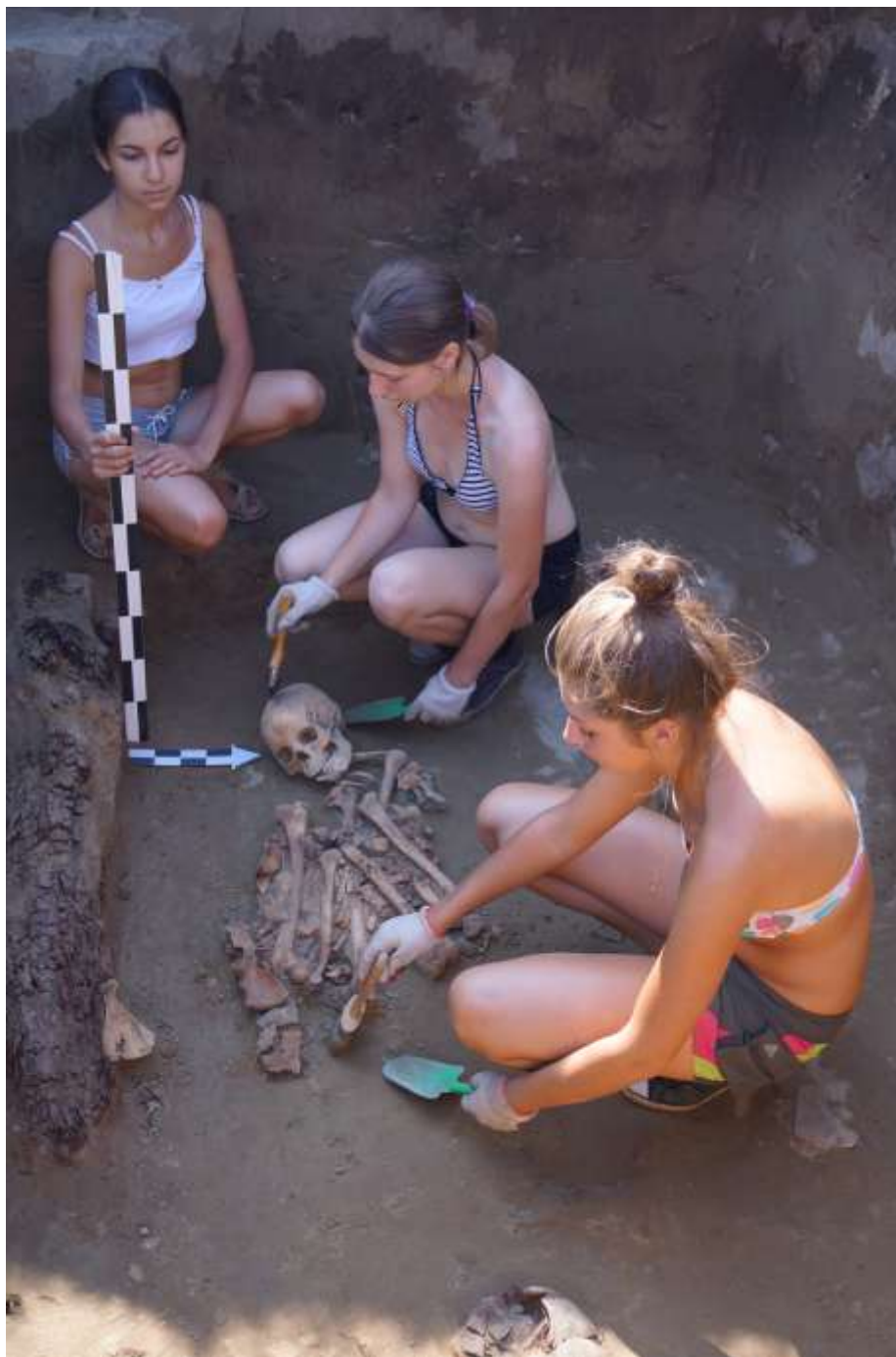
Рис. 1. Раскопки погребения могильника таштыкской культуры Староозначенская Переправа в 2012 г.

Исследование было основано на сборе, систематизации имеющихся и привлечении новых источников разного рода (преимущественно, археологических), оперативном обсуждении полученных результатов в экспертной среде, введении их в научно-учебный оборот, обобщении достигнутых результатов в целом по проекту. Содержание работ за отчетный период составило комплекс фундаментальных исследований разнопланового характера. Проводился комплекс самостоятельных археологических раскопок на ряде территорий региона (рис. 1–2). Изучались коллекции средневекового оружия, в том числе принадлежащие частным лицам (рис. 3).