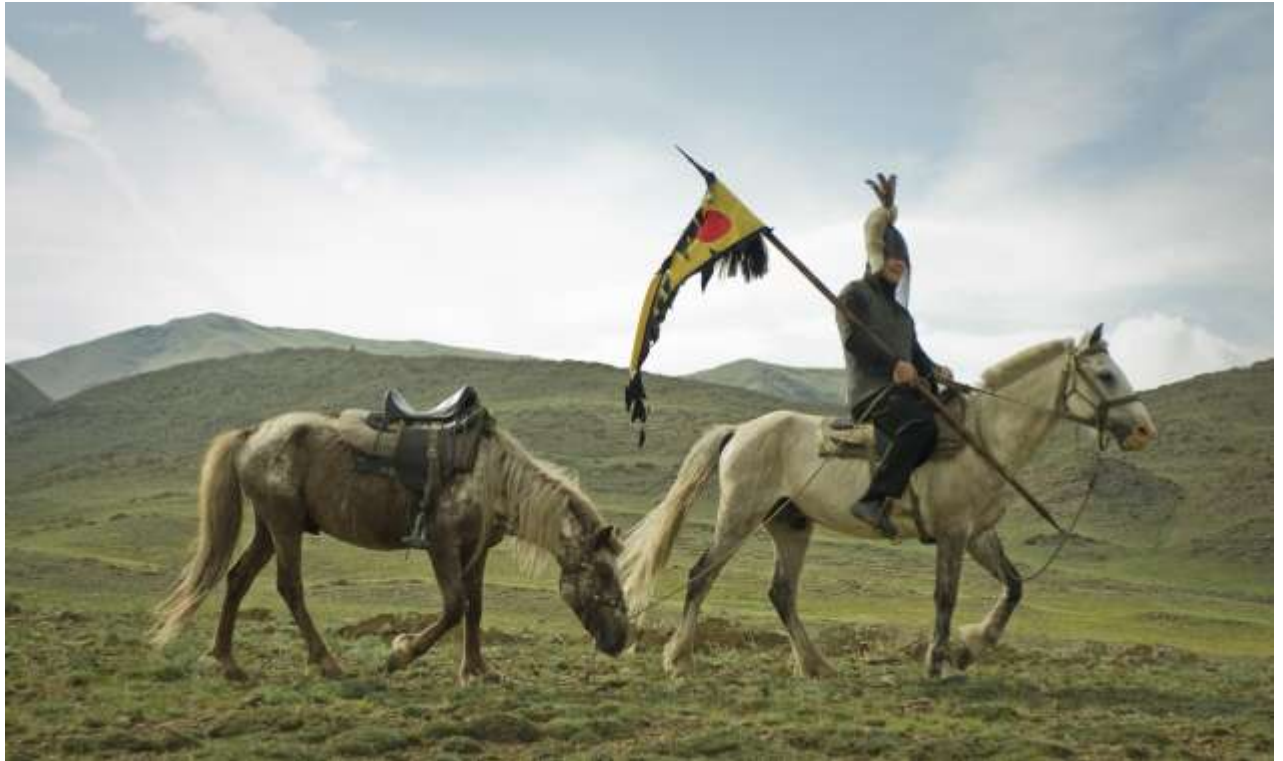
Рис. 5. Натурная реконструкция комплекта защитного и наступательного вооружения средневекового населения Тувы; выполнил Ю. А. Филиппович

В рамках этих государств происходили наиболее интенсивные межкультурные и межэтнические контакты, процессы взаимодействия и взаимовлияния, что нашло отражение на материалах средневековых археологических памятников весьма отдаленных территорий, в том числе Восточной Европы. В позднем Средневековье и начале Нового времени в ходе тесных этнокультурных контактов русского и коренного населения на территории Южной Сибири достаточно быстро сложился единый комплекс предметов материальной культуры, что способствовало быстрому росту уровня материального благосостояния, ускоренному росту численности коренных жителей.