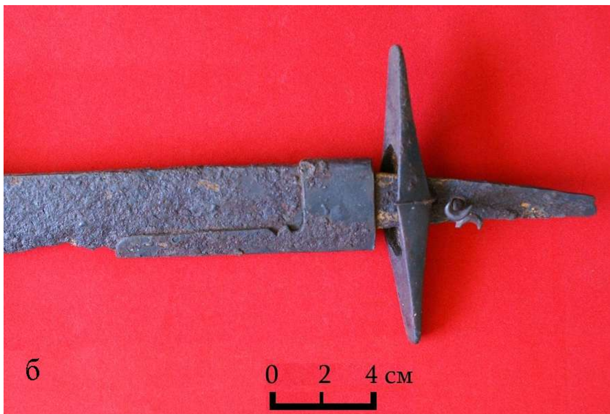
Рис. 3. Общий вид (а) и рукоять (б) сабли с двумя обоймами для ножен (железо) из частной коллекции А. Ананьина

Осуществлена систематизация основных факторов и закономерностей, определявших характер этнокультурного развития и взаимодействия между этносами и этническими группами, относящимися к различным культурно-хозяйственным типам в Южной Сибири в Средние века и начале Нового времени, определение места и роли народов региона в истории Северной Евразии в этот исторический период, установление характера и оценка первых последствий включения коренного населения региона в состав России в XVII – начале XVIII в.